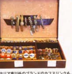
上:イタリア車以外のブランドのカフスリンクも。 ビンとコーディネートして選ぶのも一興。右:女性 向けのアンティーク・アクセサリーも扱っている。